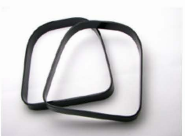
プラスチックフレーム