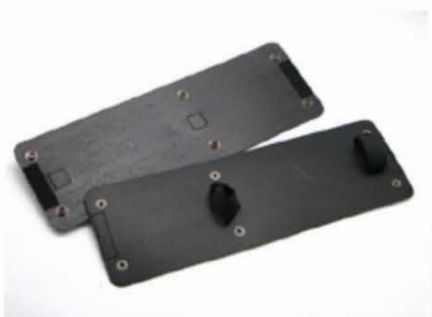
トップサポートバー