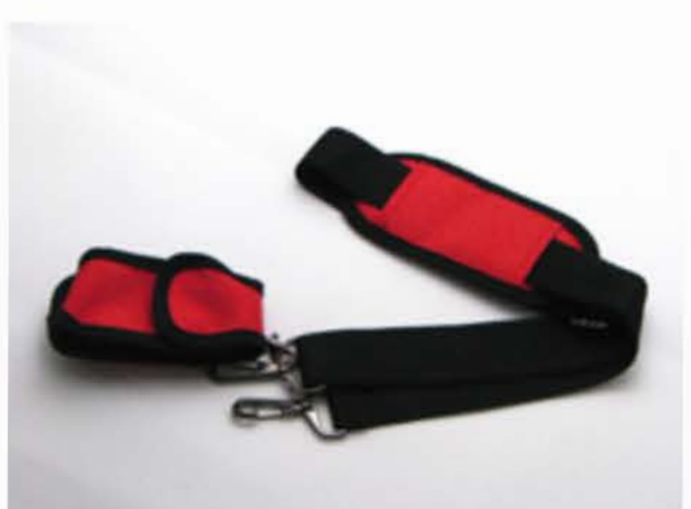
ショルダーストラップ&携帯ケース