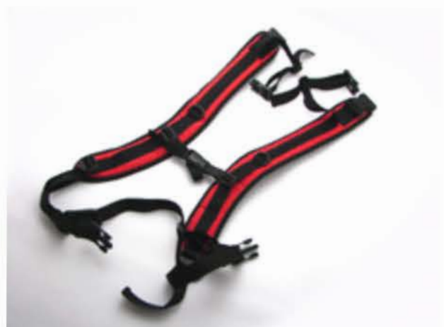
リュック用ストラップ